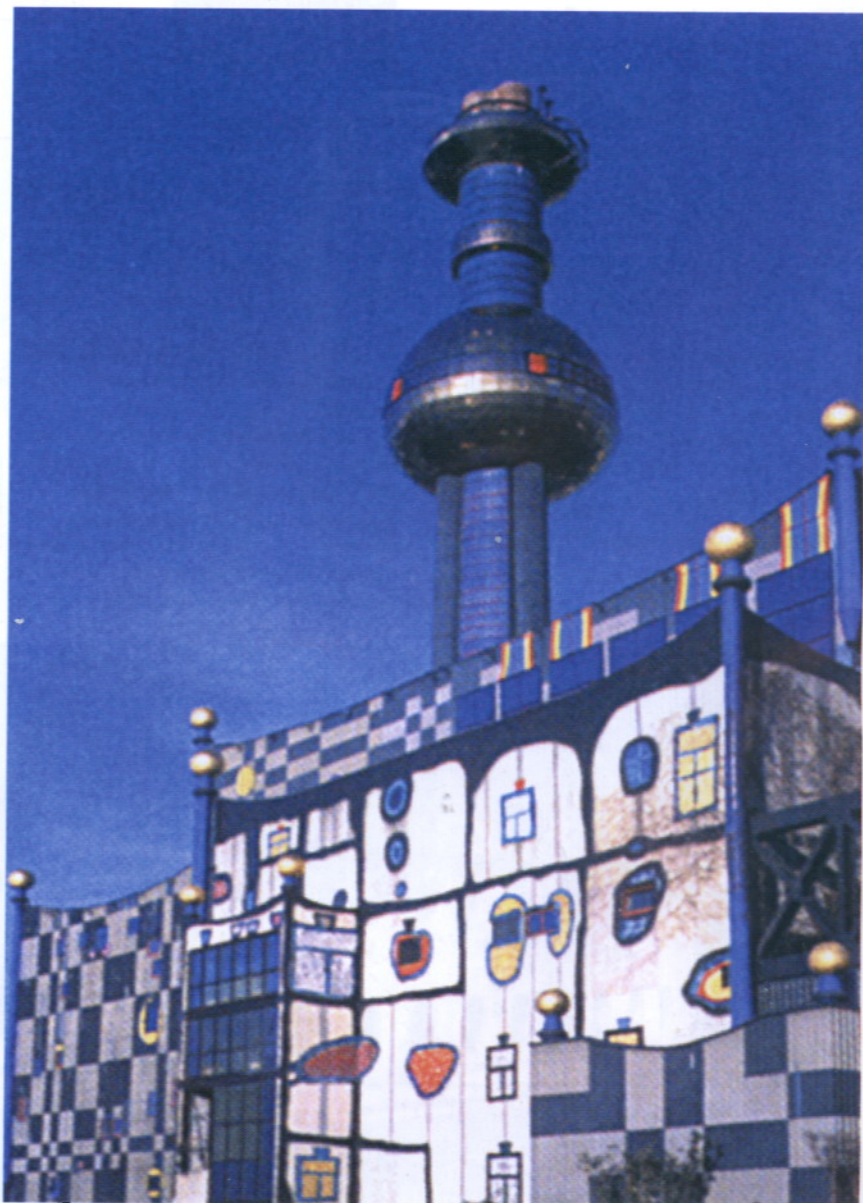
Jedna z funkcjonujących, nowoczesnych spalarni odpadów komunalnych w Europie.

Tekst i grafiki: doc. LIDIA SIEJA Instytut Ekologii Terenów Przemysłowych w Katowicach