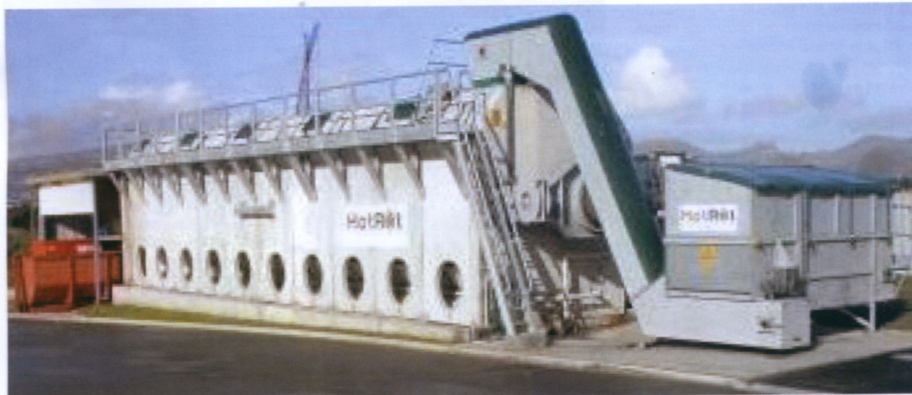
Jednostka HotRot 3518 – jest największą jednostką, wykonaną w 150-tonowej osłonie betonowej.

W nowoczesnym, kompleksowym systemie gospodarki odpadami komunalnymi nieodzownym elementem jest termiczne przekształcanie odpadów. Wśród procesów termicznych zdecydowanie dominują metody spalania odpadów na ruszce. Metody zgazowania i odgazowania, a także metody ze spalaniem w warstwie fluidalnej są ciągle na etapie początkowym, czyli eksperymentalnym - poszukiwania optymalnych rozwiązań technicznych.