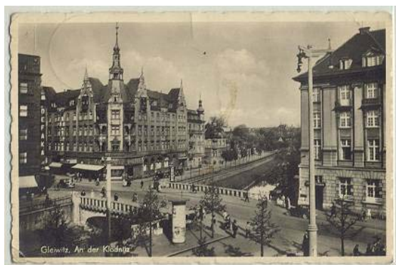
Fot.3. Kłodnica w Gliwicach.

Jedną z interpretacji nazwy Gliwice podaje, że rdzeniem nazwy jest słowo „ gliw ”, a słowo gliwy oznacza teren gliniasty i przy tym wilgotny. Większość nazw topograficznych w obrębie dzisiejszych Wielkich Gliwic wskazuje przede wszystkim na warunki terenowe, które nie sprzyjały osadnictwu. „Gliniasty, wilgotny teren, olbrzymie kompleksy leśne, stawy i bagna potwierdzają także późniejsze przekazy. Także gleby nie sprzyjały rozwojowi rolnictwa.”