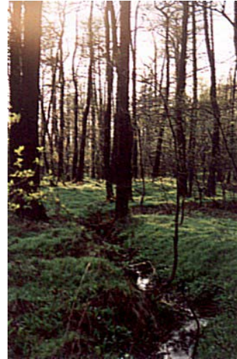
Fot. 6. Górny bieg Kłodnicy.

Źródła Kłodnicy znajdują się w południowej części Katowic, w rejonie lasów murckowskich na granicy dzielnic: Brynów, Muchowiec, Giszowiec i Ochojec. Dokładne umiejscowienie źródeł Kłodnicy jest utrudnione ze względu na coroczne zmiany warunków atmosferycznych i wilgotnościowych i związane z tym znaczne różnice poziomu wody w początkowym odcinku rzeki. Teren źródliskowy porasta las łęgowy z dobrze zachowanym drzewostanem.