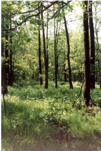
Fot.5. Źródła Kłodnicy.