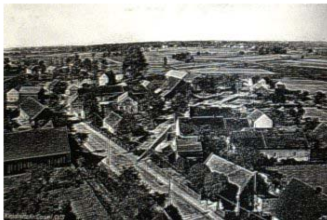
Fot. 2. Kłodnica - widok z wieży kościoła.

W Kłodnicy były dwa młyny, usytuowane nad brzegiem młynówki, łączącej rzekę Kłodnicę z Odrą. W XVII wieku Kłodnica posiadała swoje stawy. Połowy ryb były świętem dla wszystkich mieszkańców, na które przybywały również ważne osobistości. W ostatnich latach XVII wieku stawy w Kłodnicy zaczęto wysuszać i zasypywać, a powodem tego był brak odpowiedniej sieci dróg umożliwiających transport ryb.