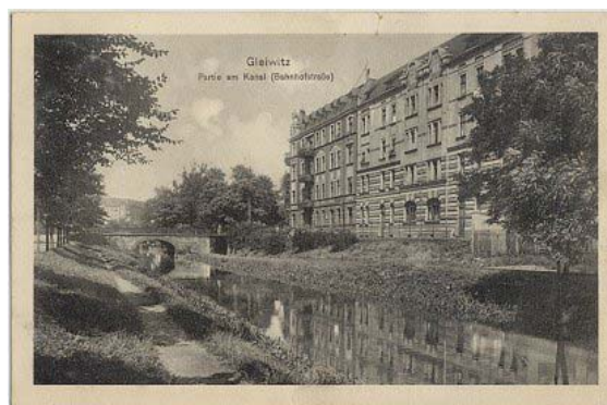
Fot.4. Kanał Kłodnicki. Widok na most ulicy Dworcowej.